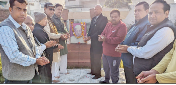
भिवानी। स्व. सेठ भगीरथमल के चित्र पर पुष्प अर्पित करते हुए।

चरखी दादरी। जिला के लोगों को लगभग 180 करोड़ रूपए की लागत की परियोजनाओं की सौगात मिलने जा रही है। प्रदेश के मुख्यमंत्री मनोहर लाल खंडोवा काफ़िस से 20 परियोजनाओं का उद्घाटन और 10 परियोजनाओं की आधारशिला रखेंगे। उपायुक्त मनदीप कौर ने बताया कि दादरी के लोगों को कई बड़ी परियोजनाओं का लाभ मिलने वाला है। कल यानी 7 मार्च को मुख्यमंत्री मनोहर लाल खंडोवा काफ़िस के माध्यम से जिला को लगभग 180 करोड़ रूपए की विकास परियोजनाओं की सौगात मिलेगी। इनमें मुख्य तौर पर बाढ़दा ब्लॉक के 35 गांवों के लिए तैयार पेयजल योजना शामिल है, जिसपर लगभग 112 करोड़ रुपये की लागत आया है।