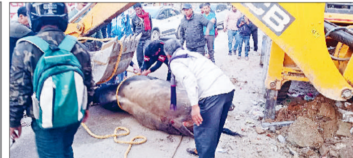
भिवानी। गड्डे में गिरे सांड को जेसीबी से निकालते गोरक्षक।

जाएगा और अगले सप्ताह तक लाइटें लगवाए जाने का कार्य शुरू करवा दिया जाएगा। शहर में पुरानी लाइटों की मरम्मत करवाई जाएगी। ताकि उन लाइटों को भी प्रयोग में लिया जा सके। शहर की सभी गली व चौक चौराहों पर लाइटें लगवाई जाएगी। जहां पर अब लाइटें नहीं हैं। उन जगहों पर लाइटें लगवाई जाएगी। पूरे शहर की सुंदरता को बढ़ाया जा सके।