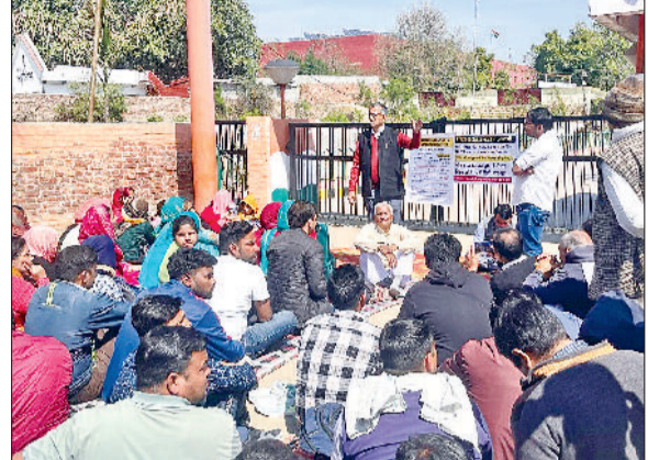
भिवानी। शिक्षा बोर्ड के आगे घरने पर बैठे एचटेअ के अभ्यर्थी।